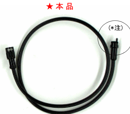
品番: V013946 メーカー品番: P230-1X