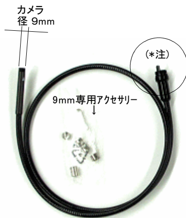
品番: V013991 メーカー品番: P495-1N